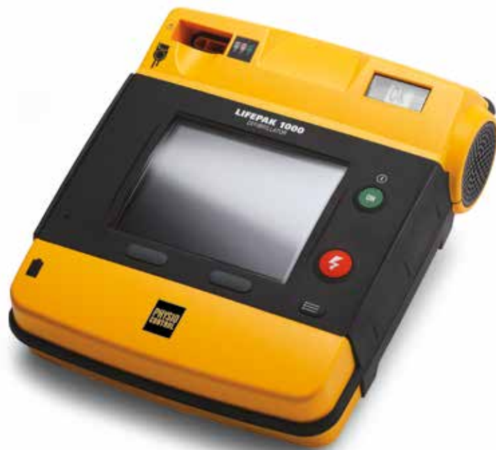
DÉFIBRILLATEUR LIFEPAK® 1000